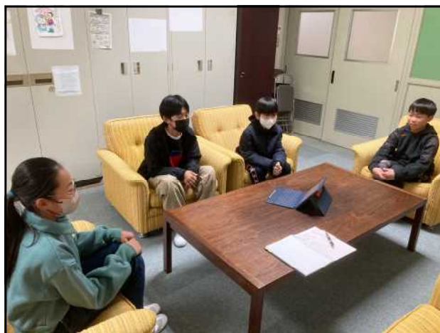
来室した4人の学級委員

遡ること昨年(2025)の12月。1組、2組の学級委員4人が校長室に来室し、「卒業旅行に行きたいから許可を出してほしい。」と、話がありました。そして「授業時間を使って旅行に行くのだから、遊びと思われぬように、自分たちでルールを決めたり、ひとりぼっちを作らないように配慮したりしていきたい。」と、旅行に向けたルールや約束事まで話していました。