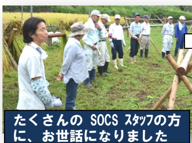
たくさんの SOCS スタッフの方に、お世話になりました