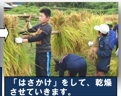
「はさかけ」をして、乾燥させていきます。