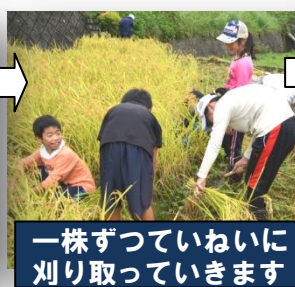
一株ずついねいに刈り取っていきます