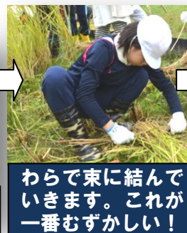
わらで束に結んでいきます。これが一番むずかしい！